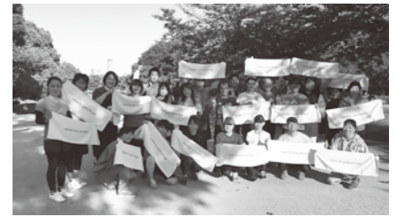
▲モーニングラン&ウォーク 参加員のタオルには学会の標語「Unite for Limb salvage」の文字入り