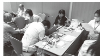
▲市民公開講座でのフットケアの様子 (第9回日本下肢救済・足病学会学術集会より)