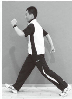
▲図1. 大股歩き (歩幅が広いと着地の衝撃が大きい)

歩く(ウォーキング)と言えば図1で示す様な「膝を伸ばし大腿で腕をしっかり振り踵から着地」という歩く方法を見聞きした方が多くいらっしゃると思います。ウォーキング運動の強度を高める為には、この歩き方がとても有効です。実はこの歩き方、着地の際に「踵・膝・腰」へ衝撃が強く身体への負担が高くなる恐れがあるのです。特に膝・腰に不安を抱える方は図2で示す様な歩き方を行なって下さい。ポイントは3つです。1)腕振りには自然に行い、2)膝は伸ばし切らずに足の裏全体で着地する。3)個人毎に歩きやすい歩幅で歩く。この方法で歩くと着地に伴う足への衝撃を約3分の1にまで減らす事が出来ます。より運動強度が高いウォーキングを行いたい方は図2の歩き方で、歩く「スピード」を速めて下さい。肥満の方や関節などに不安のある方は特に下肢への衝撃を抑える歩き方を習得して実践しましょう。怪我をせずに運動を継続する事が糖尿病の改善・予防につながります。