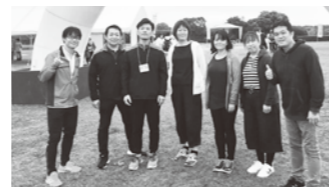
▲第15回ふれあい健康ウォーク (海の中道海浜公園にて)