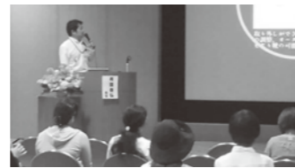
▲講演の様子 (第1回くまもと実践フットケアより)