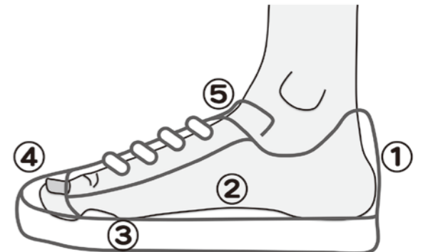
▲図. 試し履き、5つのポイント

また、足は左右一緒の様で実は違いがありますので必ず両足で試し履きしてください。そして、少し動いて頂き何か問題がないか確認することも必要です。