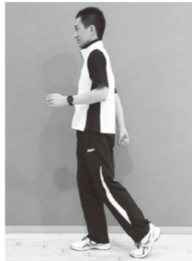
▲図2. 怪我をしない歩き方 (歩幅が狭いと着地の衝撃が小さい)