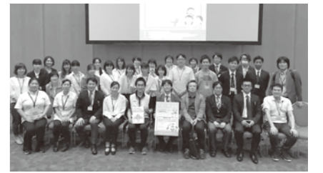
▲市民公開講座を担当したスタッフ

一方、学術集会では「垣根のない連携『福岡モデル』が未来の足」をテーマに、医療現場や足に関わる職種の方々へ、これまで当NPOが取り組んできた取り組み、活動理念・体制について発表させて頂きました。当NPOの取り組みに関する報告が「足を守る」為の様々な団体、サークルにとって有益な情報発信・提供になったとすれば幸いです。その他にも、当NPO主催で「福岡の朝を駆け抜けろ モーニングラン&ウォーク」を学術集会初で企画・開催させて頂きました。早朝から多くの学会関係者の皆様にご参加頂き爽やかな汗を流すことが出来ました。